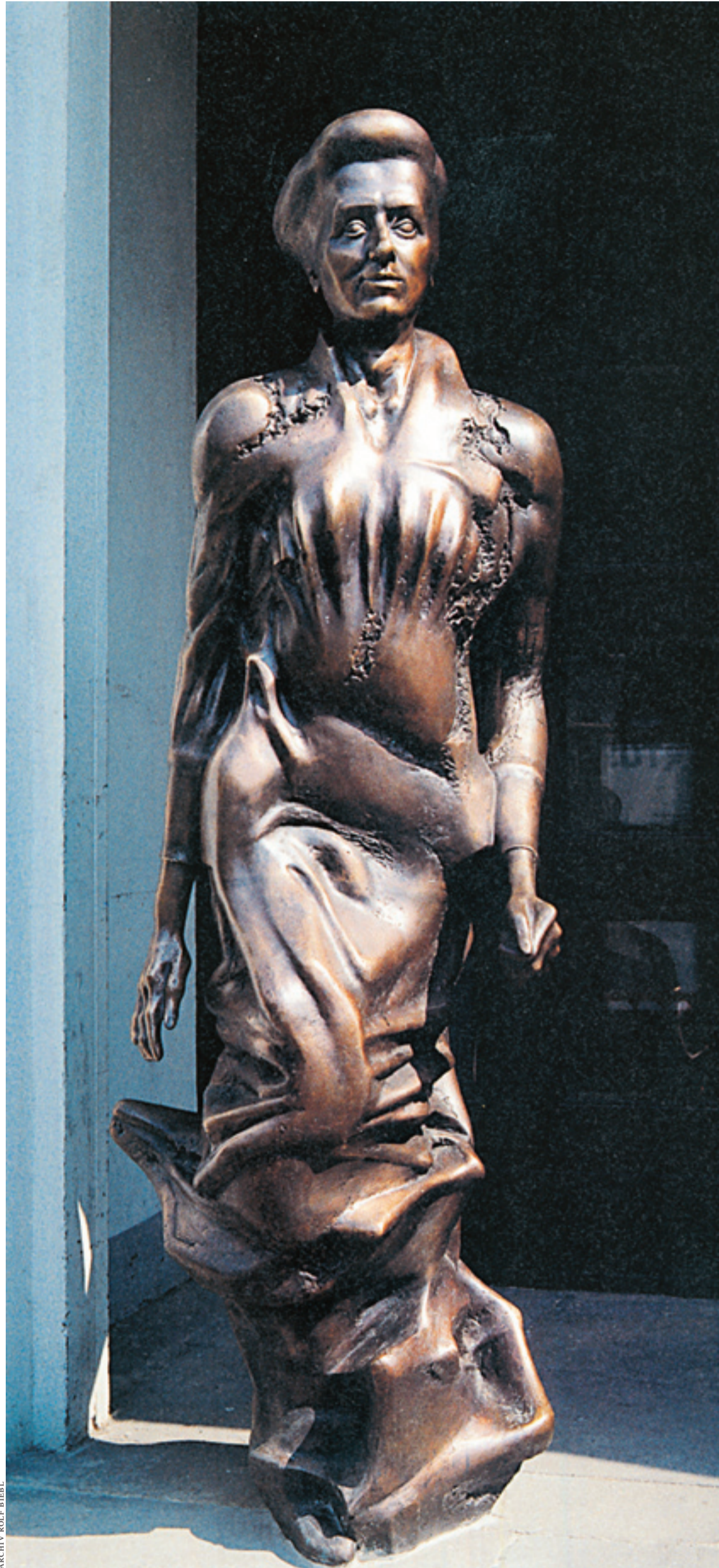
ARCHIV ROLF BIEBL