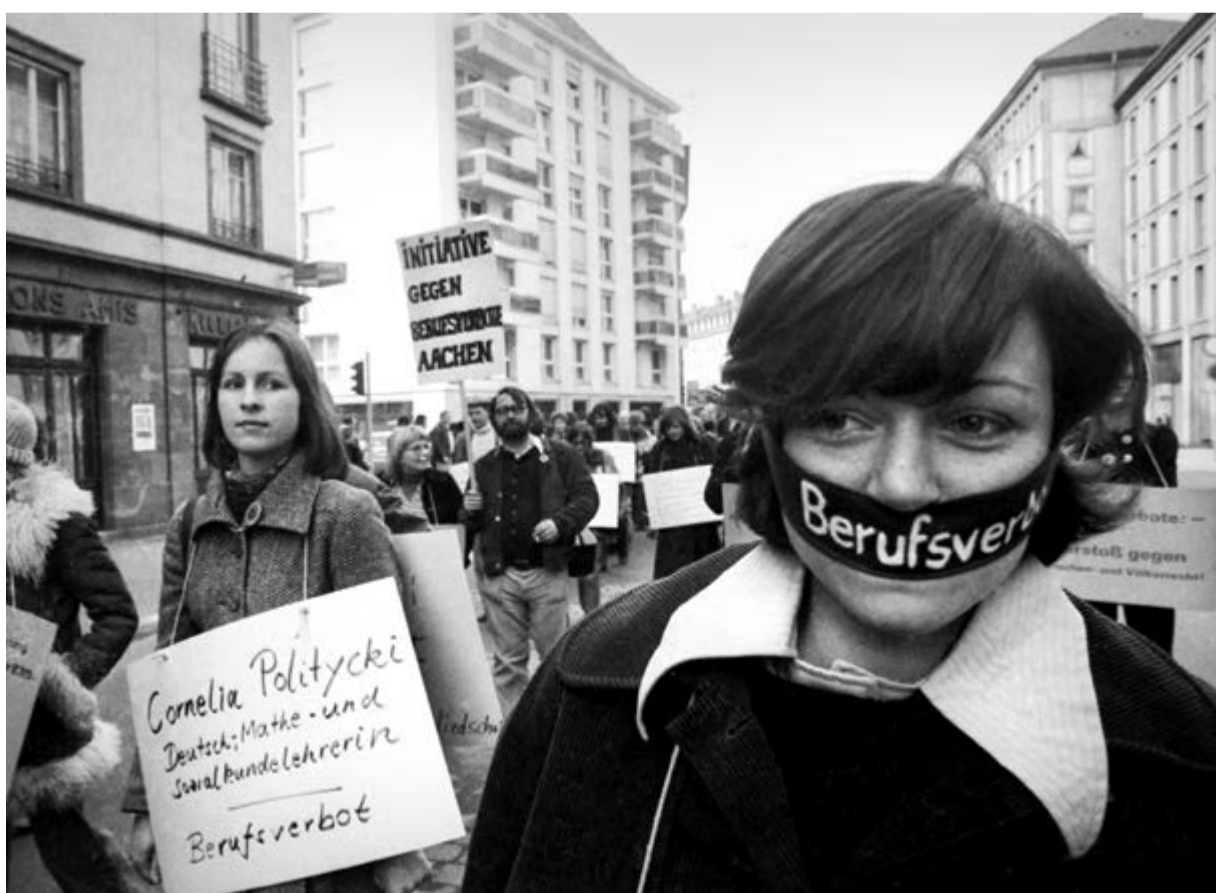
Betroffene der Berufsverbote warten bis heute auf Gerechtigkeit: Protest gegen den »Radikalerlass« in der BRD vor dem Parlament der Europäischen Gemeinschaft (Strasbourg, 13.3.1976)