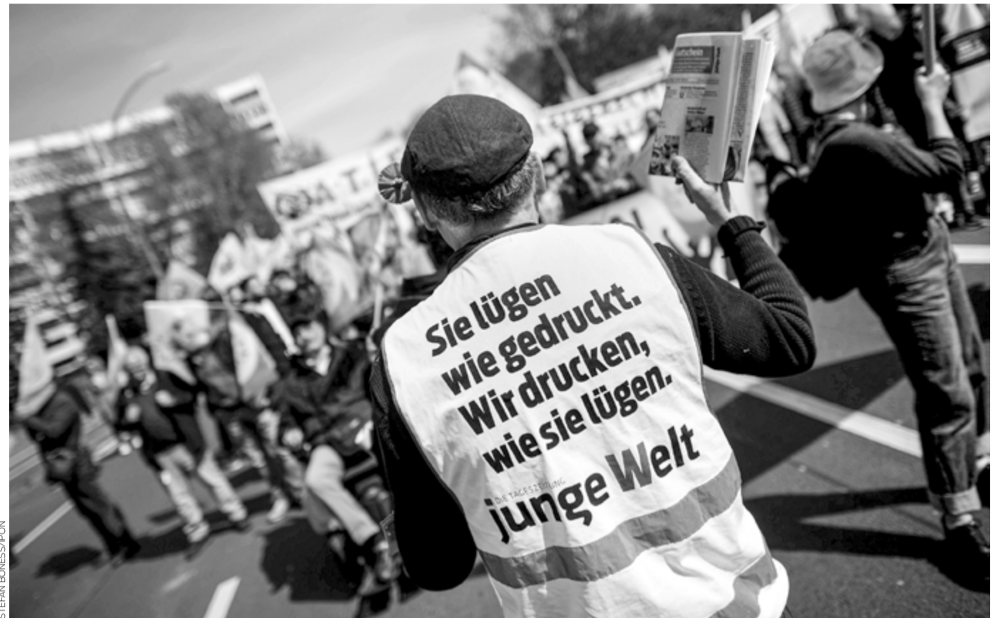
Angieblicher Beleg für Umsturzabsichten der jungen Welt : Zeitungsverteilung durch Mitarbeiter des JW -Aktionsbüros auf der Demonstration »Wir zahlen nicht für eure Krise« (Berlin, 1.5.2023)

... die Sie sich schon immer (oder eben erst jetzt) gestellt haben