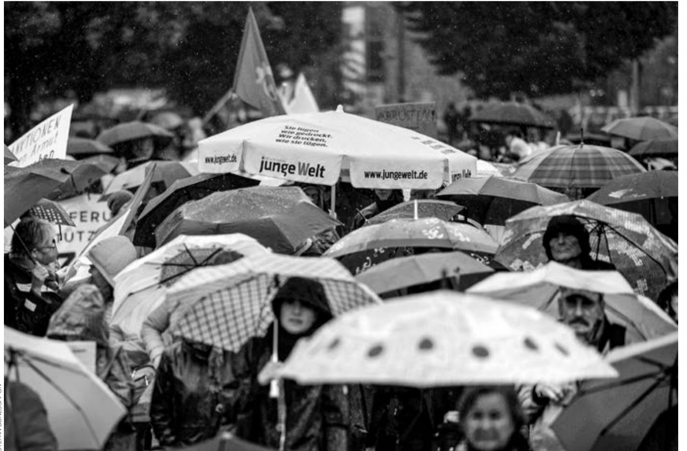
Angeblicher Beleg für Umsturzabsichten der jungen Welt : Verteilstand des jW -Aktionsbüros auf dem bundesweiten Aktionstag der Friedensbewegung (Berlin, 1.10.2022)

In den inkriminierten Geheimdienstberichten wird die jW mit einer täglich verkauften Auflage von über 21.000 Exemplaren als das »bedeutendste und auflagenstärkste Medium im Linksextremismus« bezeichnet. Weiter heißt es: »Die jW ist mehr als ein Informationsmedium. Sie wirkt als politischer Faktor und schafft Reichweite durch Aktivitäten wie zum Beispiel die Durchführung der alljährlichen Rosa-Luxemburg-Konferenz.« Und eben diese Reichweite, ohne die keine Tageszeitung wirtschaftlich überleben könnte, gilt es nach Angaben der Bun-