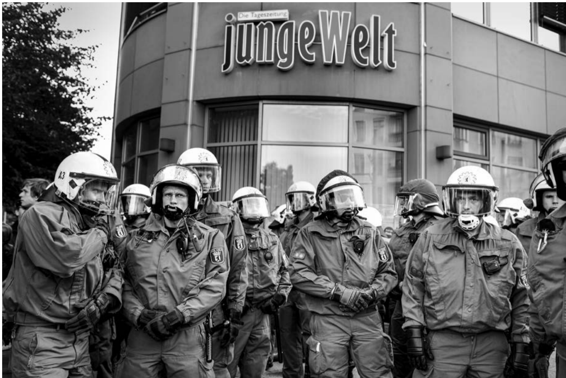
Massiver Polizeischutz für Faschisten – zuvor hatten Behörden eine NPD-Kundgebung direkt vor das Gebäude der jW -Redaktion in Berlin-Mitte verlegt (17.6.2011)

Grundrechte verteidigen +++ Wie der Staat der Tageszeitung junge Welt den Nährboden entziehen will