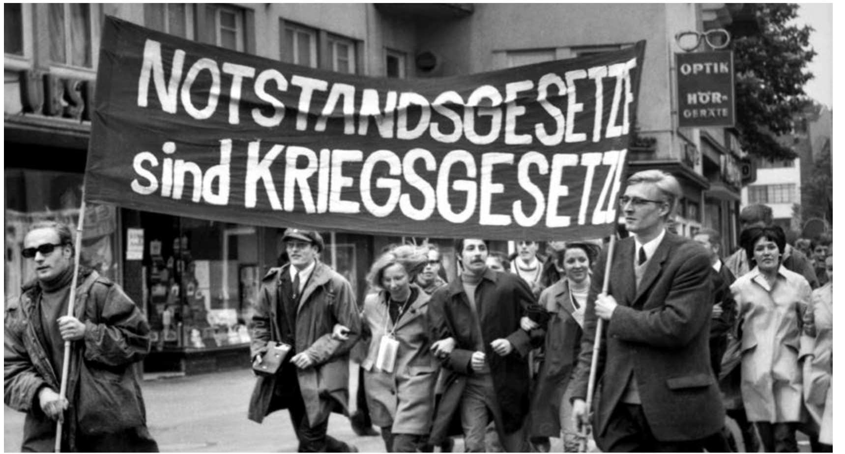
Zäsurjahr 1968: Protestmarsch gegen die »Notstandsgesetze« (Bonn, 11.5.1968)

Mit dem Ende der sozialistischen Länder Europas begann eine neue Etappe in der